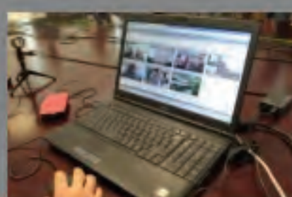
Ελεύθερη πρόσβαση στο διαδίκτυο