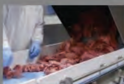
McDonald's: Έτσι φτιάχνουμε τα μπέργκερ