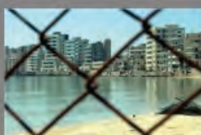
Δικονομικές δράσεις για την Αιμολύωστο