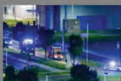
Νεκρός από τον Έμπολα στη Γερμανία