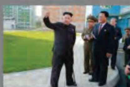
Επανεμφανίσθηκε ο Κιμ Γιονγκ Ουν